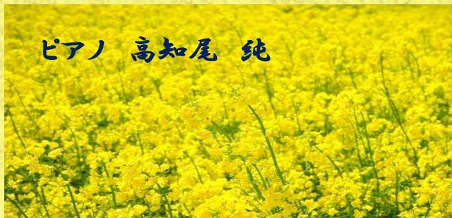
ピアノ 高知尾 純